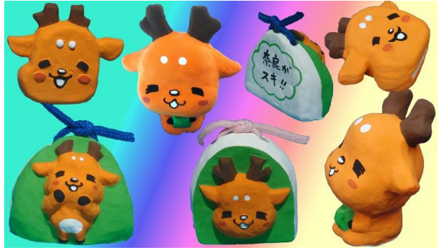
奈良市観光協会 マスコットキャラクター しかもろくん