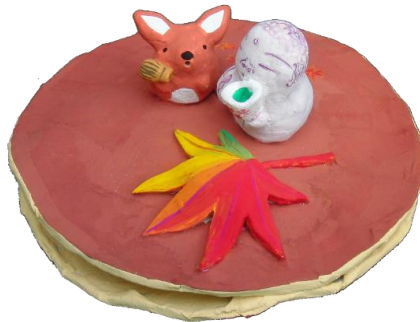
大仏様と紅葉狩り on 三笠焼