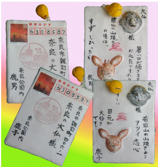
風景印シリーズ (鹿)