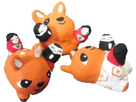
パペット鹿 雛遊び (雛は張り子)