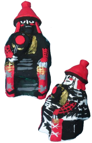
大河ドラマで人気 官兵衛さん